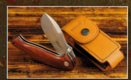
Made in Italy: Neues Böker Plus Mojo

Taschenmesser, die überall legal getragen werden dürfen