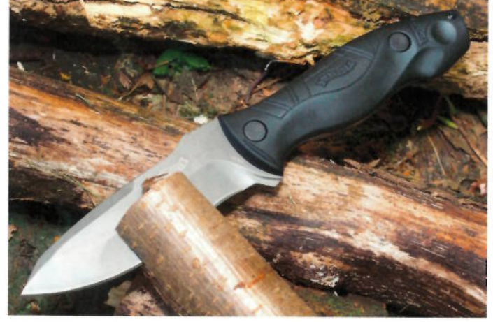
Arbeitstier: Auch vor dickerem Holz macht das FBK nicht halt. Deutlich zu sehen ist die Kombination von Hohl- und Flachschliff.