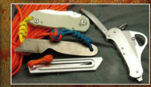
Workshop: Paracord-Lanyards knüpfen