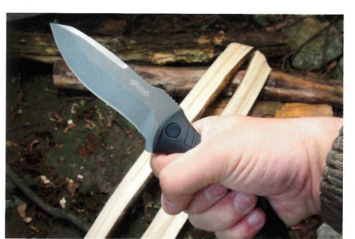
Super Handlage: Kleinen und großen Händen bietet der Griff wunderbar Halt. Gummiertes G-10 sorgt für den nötigen Grip.