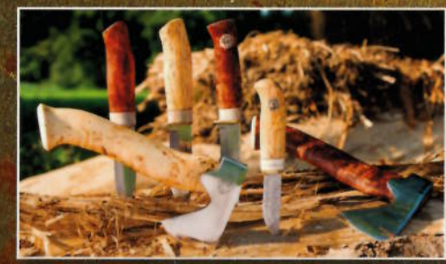
Schweden-Porträt: Karesuando Kniven